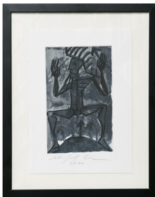
Mimmo Paladino. Incisione, anni '80. 32,4x24cm. Tiratura di 12 esemplari, la ns numero 6/12. Incorniciata.

Ellis Bierbar libri via Varese, 12 - 20121 Milano tel. +39 02 62086886, mobile +39 338 6319985 info@ellisbierbar.it www.ellisbierbar.it