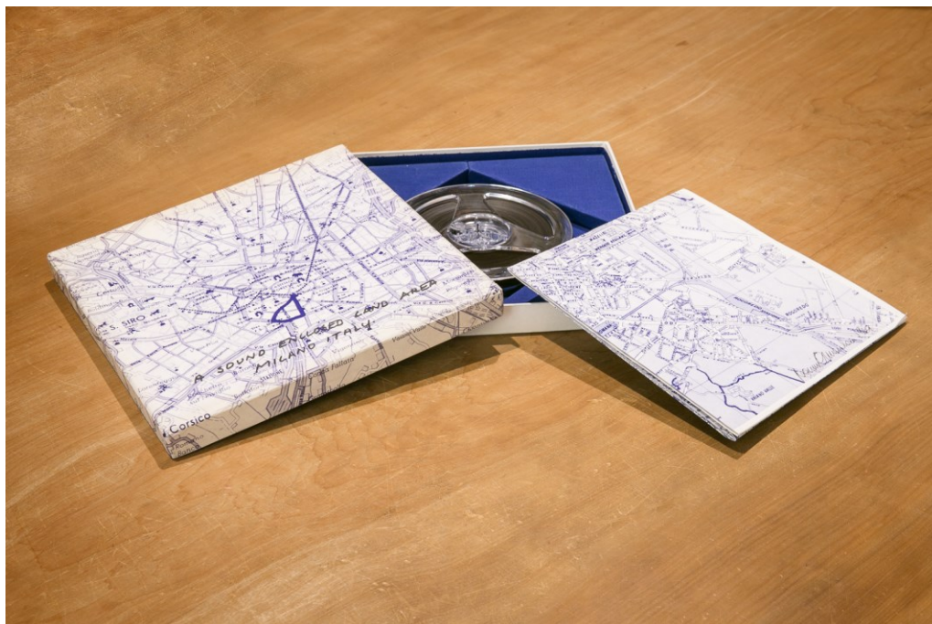
Dennis Oppenheim – A sound enclosed land area . Multiplo/libro d'Artista. 1969 Lambert-Mazzotta. Scatola contenente una bobina audio e una cartina topografica di Milano numerata, firmata e datata dall'Artista. Edizione di 90 esemplari, la ns. 89/90.

via Varese, 12 - 20121 Milano, tel. +39 02 62086886, mobile +39 338 6319985, info@ellisbierbar.it www.ellisbierbar.it