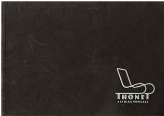
#23: Thonet Stahlrohrmöbel