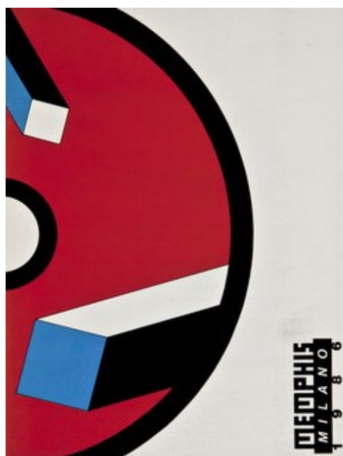
#16 Memphis – Milano 1986