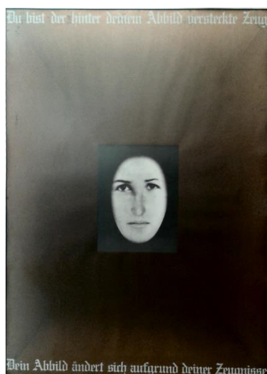
AGNETTI Vincenzo, Note sul ritratto di tutti (Du bist). Ed. Jabik & Colophone, 78x105cm. Tiratura di 100 + X, la ns. numero 97, 1975. € 1000,00