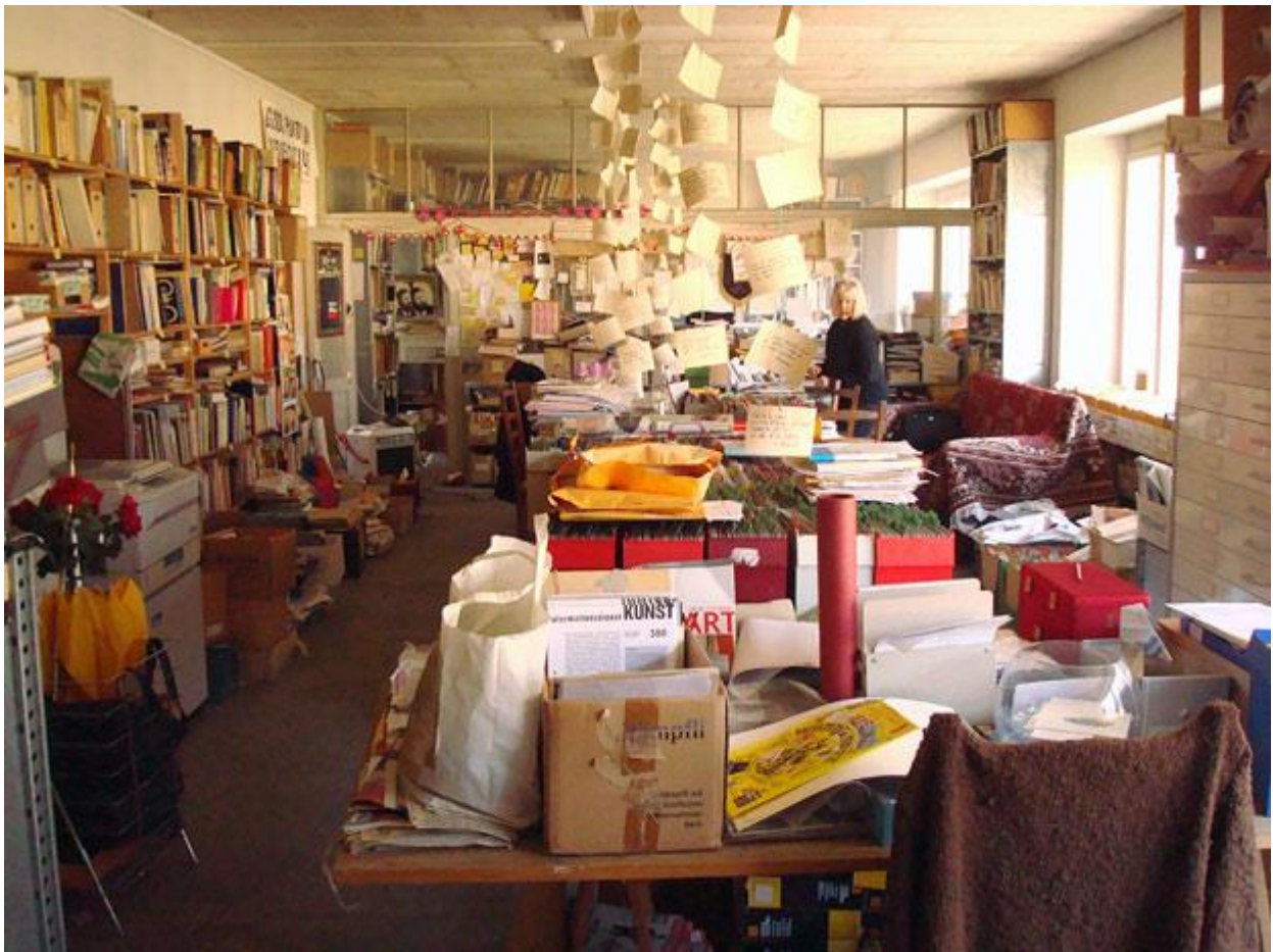
Harald Szeemann's workroom in his fabbrica in Maggia, Switzerland.