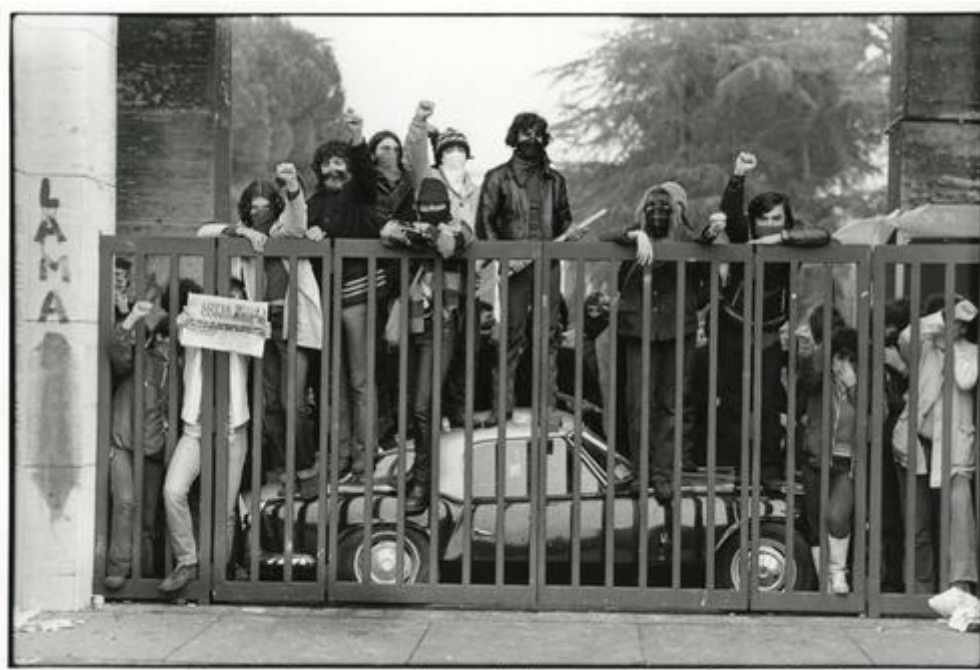
Roma 1977. Dopo la cacciata di Lama TONO D'AMICO